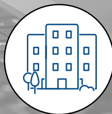
SYNDICS DE COPROPRIÉTÉ